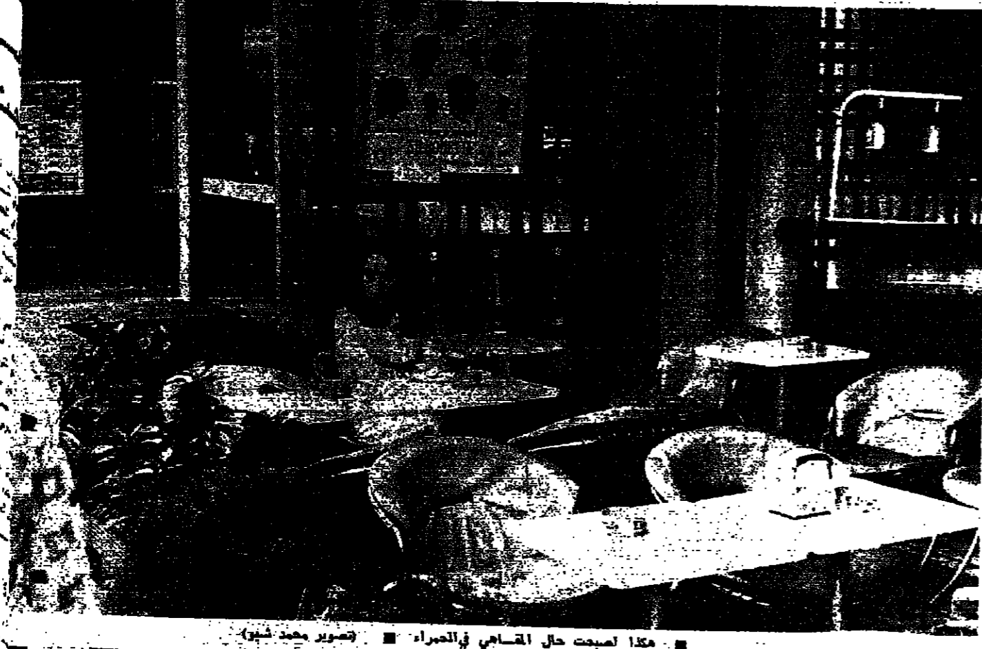
مكلا أصبحت حال القاسم في الجزائر